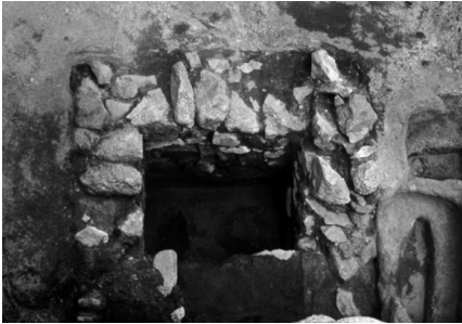
▼ Cup per al vi d'època romana. Roc d'Enclar.

obtinguts per la recerca arqueològica. Aquesta darrera ha estat prolífica a la veïna Cerdanya, amb resultats molt importants, que han contribuït a traçar un relat fidedigne d'aquesta època històrica. Andorra, ateses les seves estructures d'estat, també ha fet una bona feina en els darrers quaranta anys, especialment des de les campanyes d'excavació al roc d'Enclar, convertides en un referent pirinenc, pel que fa als estudis antics i altmedievals. 2